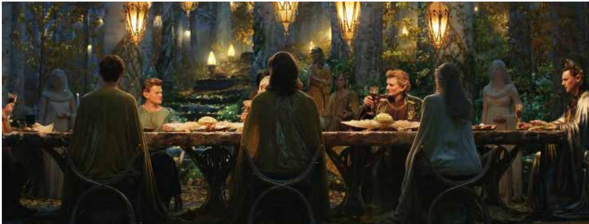
El Señor de los Anillos