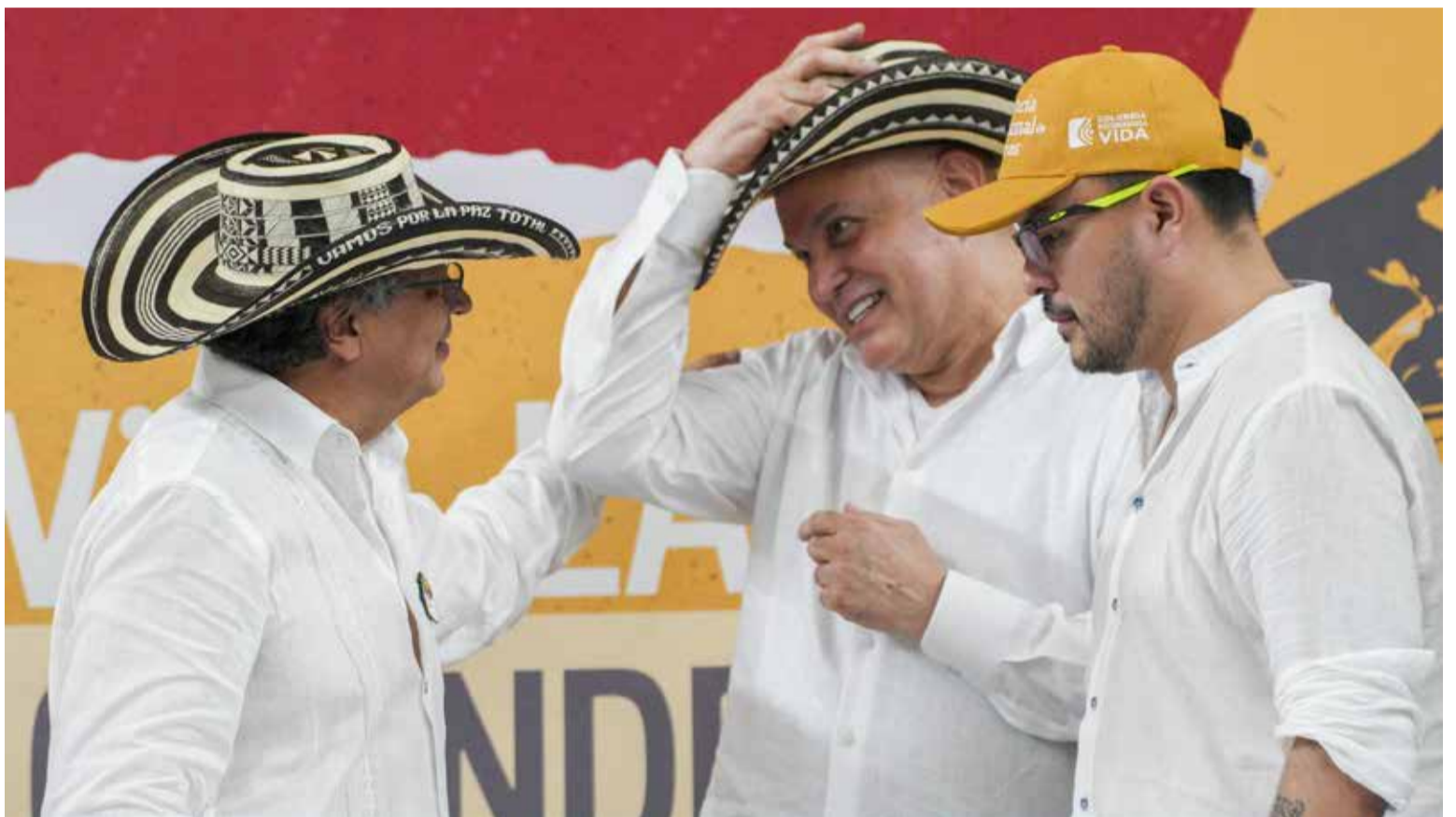
El presidente Petro y el otrora comandante de los paramilitarios Salvatore Mancuso trabajan por la paz de Colombia.

El presidente colombiano, Gustavo Petro, se encontró este jueves con el ex jefe paramilitar Salvatore Mancuso en un evento de entrega de tierras en el departamento de Córdoba, donde este último pidió perdón a las víctimas y se comprometió a trabajar por la reparación. En el evento 'Tierras para la reconciliación' en Montería, capital del departamento de Córdoba, se encontraron por primera vez Petro y Mancuso desde que este regresara al país el pasado 27 de febrero, tras ser deportado de Estados Unidos donde cumplió en Estados Unidos una condena de 15 años por narcotráfico.