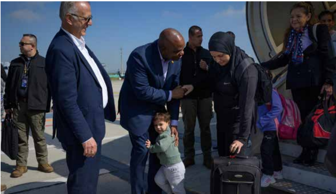
El gobierno nacional está preparando otro vuelo humanitario para traer más compatriotas que permanecen en el Medio Oriente.