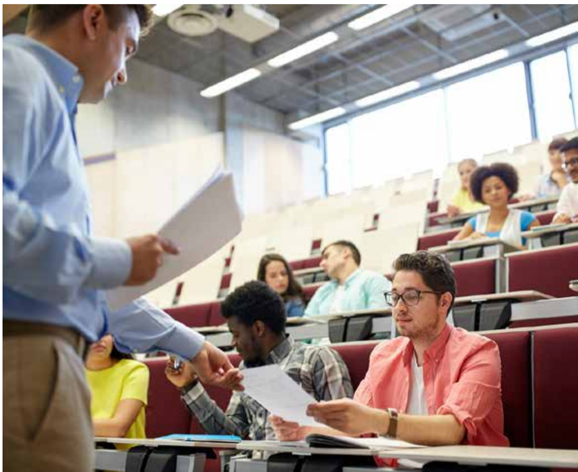
En los procesos del conocimiento deben coincidir universidades, centros de estudios, corporaciones investigativas, empresas con cultura creativa e innovadora, polos.

Desde luego, no pueden dejarse de lado los indicadores internos de gestión en la administración de la cadena de suministros para garantizar un producto de calidad. Logros alcanzados en cada nivel, grado evolutivo de destrezas cognitivas, semestres recorridos para completar los ciclos académicos, tasa de deserción, medida de refrendar, ingreso en diferentes mercados de consumidores, ubicación laboral, localización individual e institucional en el entorno, gestor del conocimiento, profundo sentido de colombianidad, pensador proactivo con principios y valores.