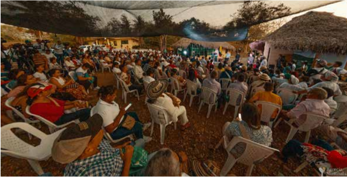
El presidente Petro denunció que predios entregados por exjefes paramilitares para la reparación de las víctimas han aparecido en poder de la organización multicrimen del 'Clan del Golfo'.