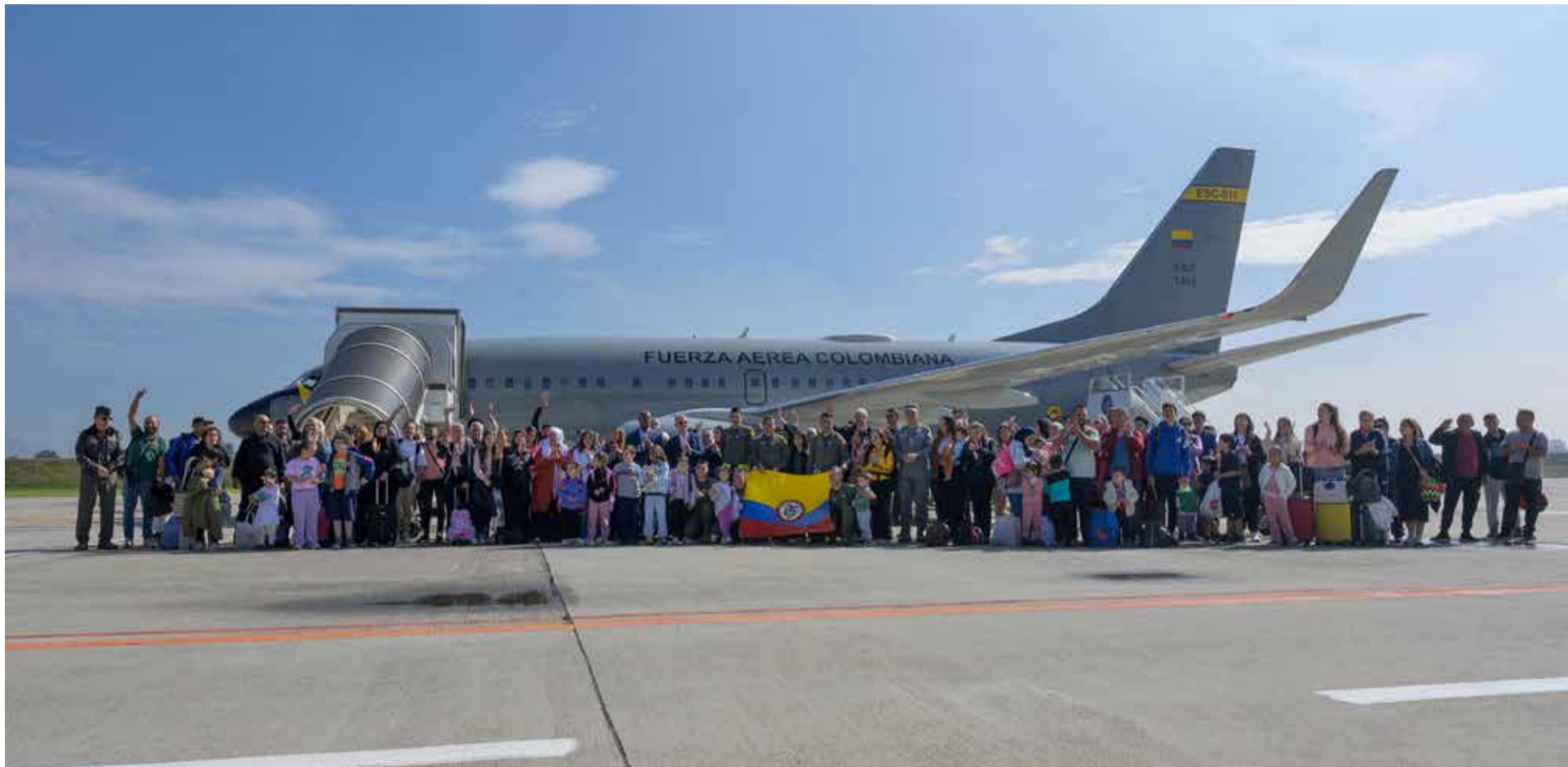
El gobierno nacional destió el regreso de 117 colombianos atrapados en la guerra.

A terrizó en Bogotá el vuelo FAC 129, con 117 pasajeros y dos mascotas, y el Ministerio de Relaciones Exteriores confirmó la llegada de connacionales desde Beirut como parte de una repatriación organizada por el Gobierno ante la escalada de la guerra en el Líbano.