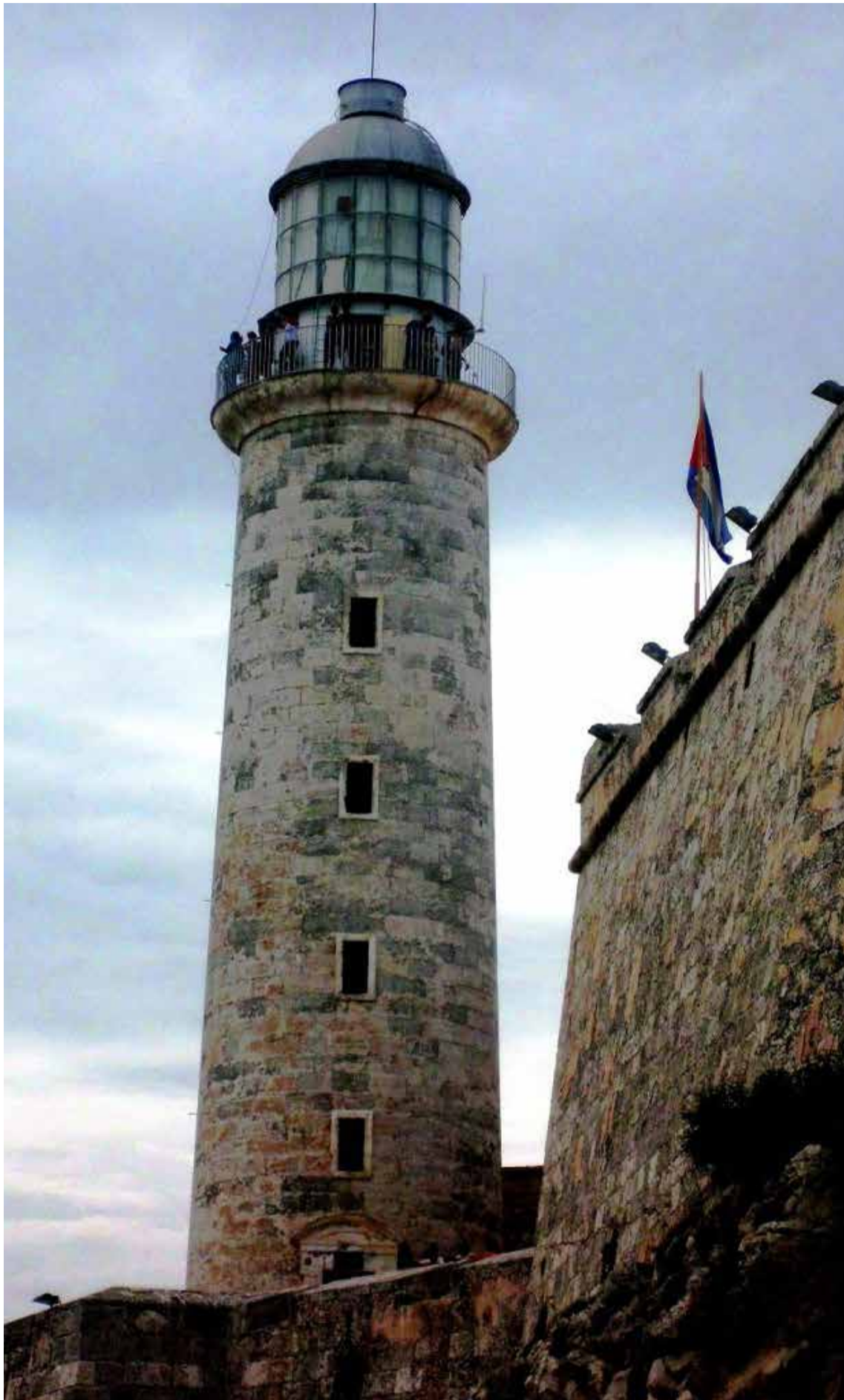
Fortaleza del Morro, en La Habana

Considera Orestes que durante los once meses que dominio de los ingleses en Matanzas y La Habana se introdujo el ferrocarril, se abrió el comercio del tabaco, entre