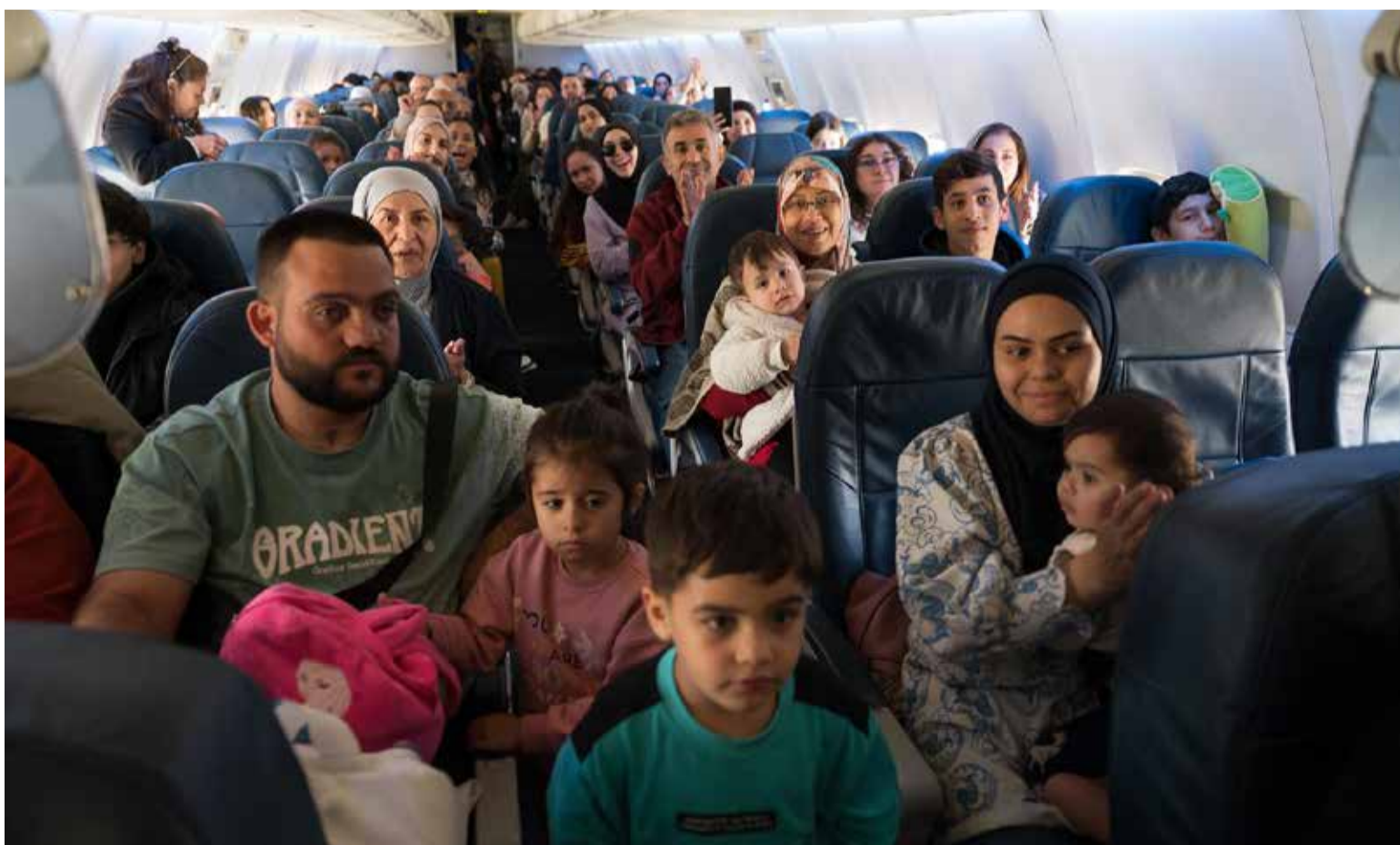
Colombianos contentos de regresar a la Patria.

La Cancillería agradeció el apoyo de la Organización Internacional para las Migraciones (OIM) y de otras entidades en la misión humanitaria organizada para transportar a los colombianos que manifestaron su deseo de regresar al país después