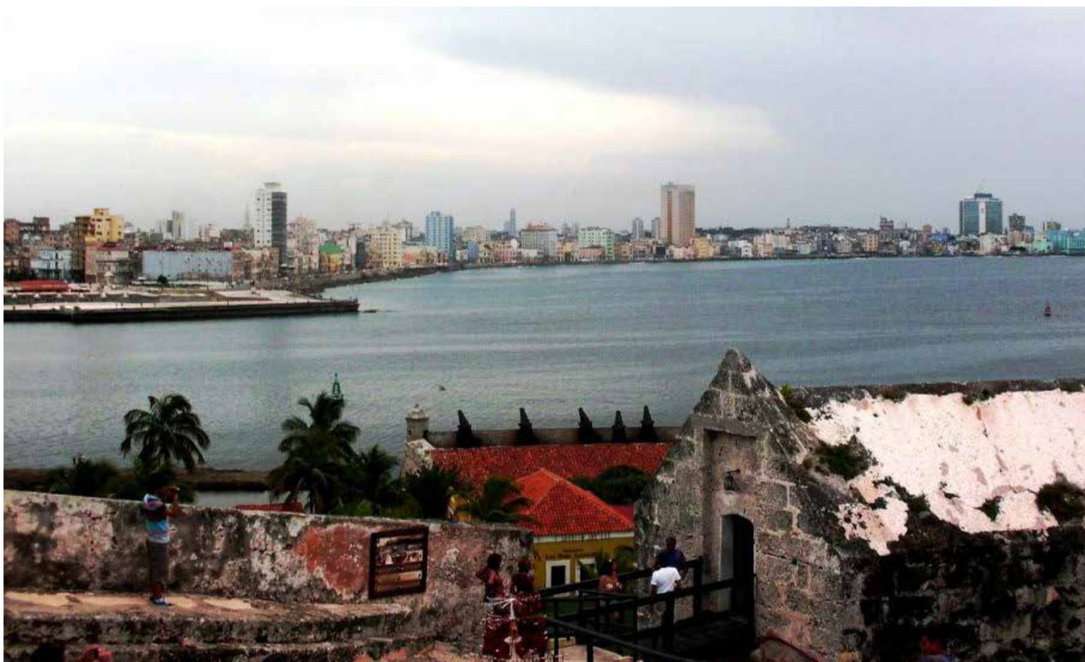
Al frente en el extremo izquierdo San Salvador de La Punta.

La primera edificación era de la tipología torre del homenaje o torreón y se encontraba a 360 varas al suroeste del Castillo de la Gran Fuerza. La obra primada constituía un cubo perfecto de diez metros de lado construido de ladrillos con refuerzos de piedras en las cuatro esquinas, que el pirata francés Jacques de Sores (Ángel Exterminador), demolió a caño-