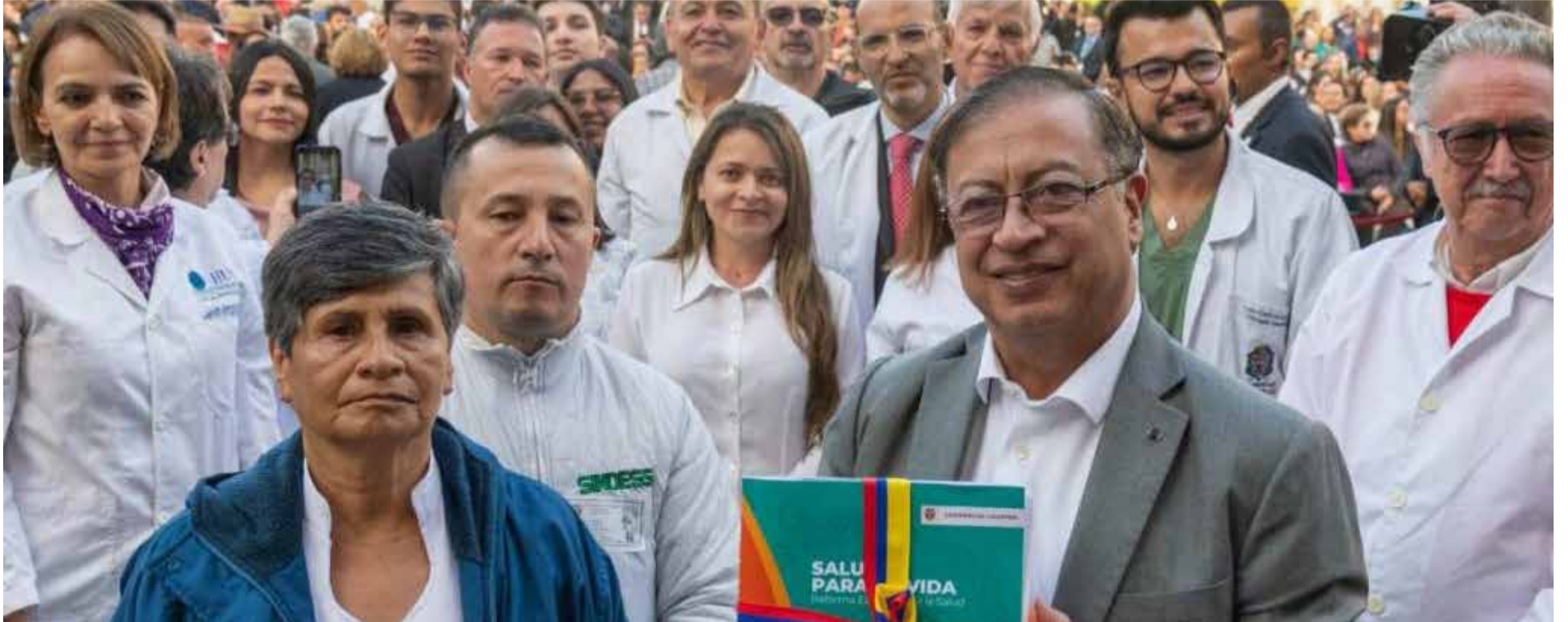
Reforma la Salud presentada por el gobierno de Petro.