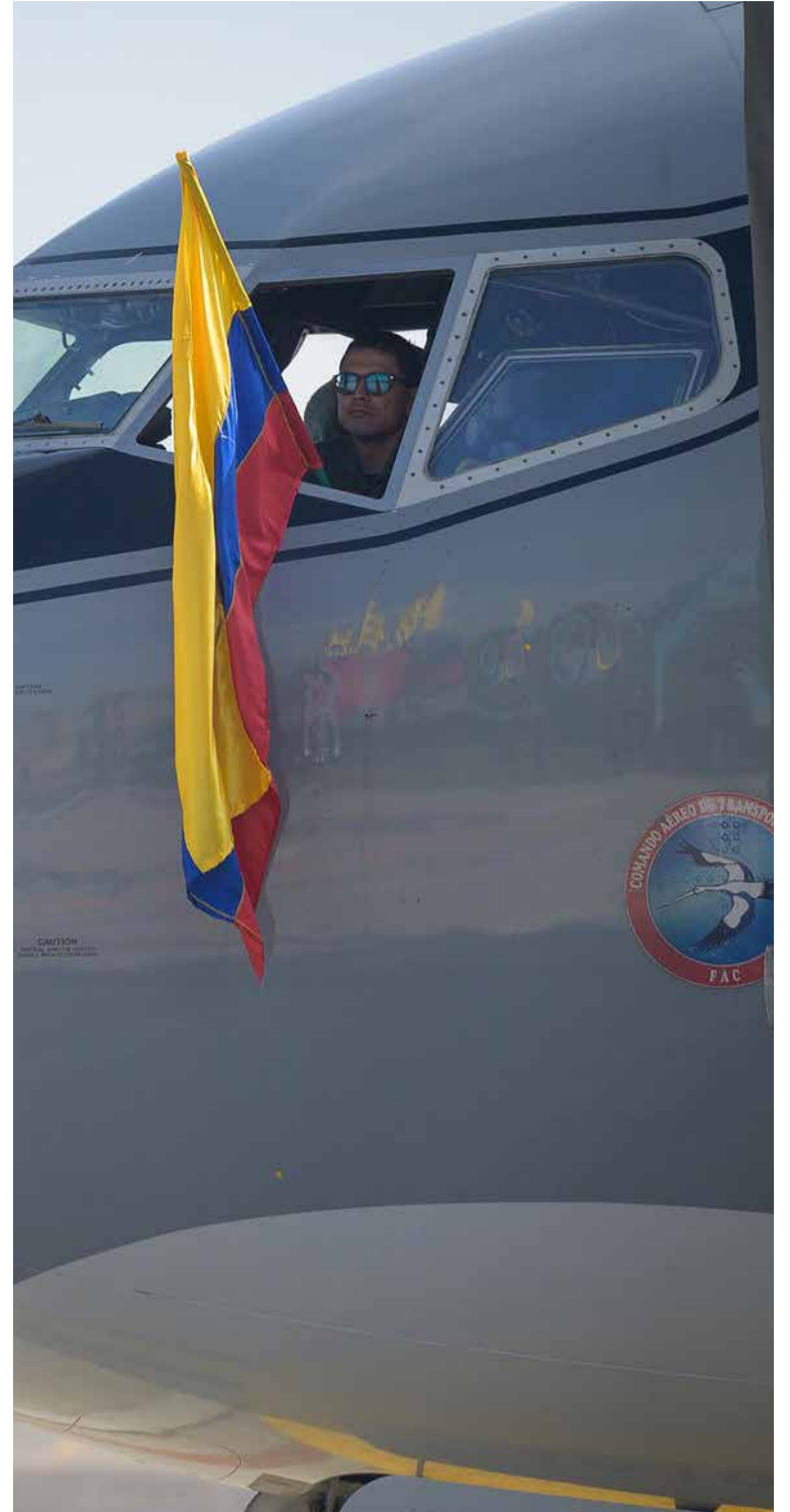
A su llegada a Bogotá la tripulación satisfecha por la labor humanitaria izó la bandera.