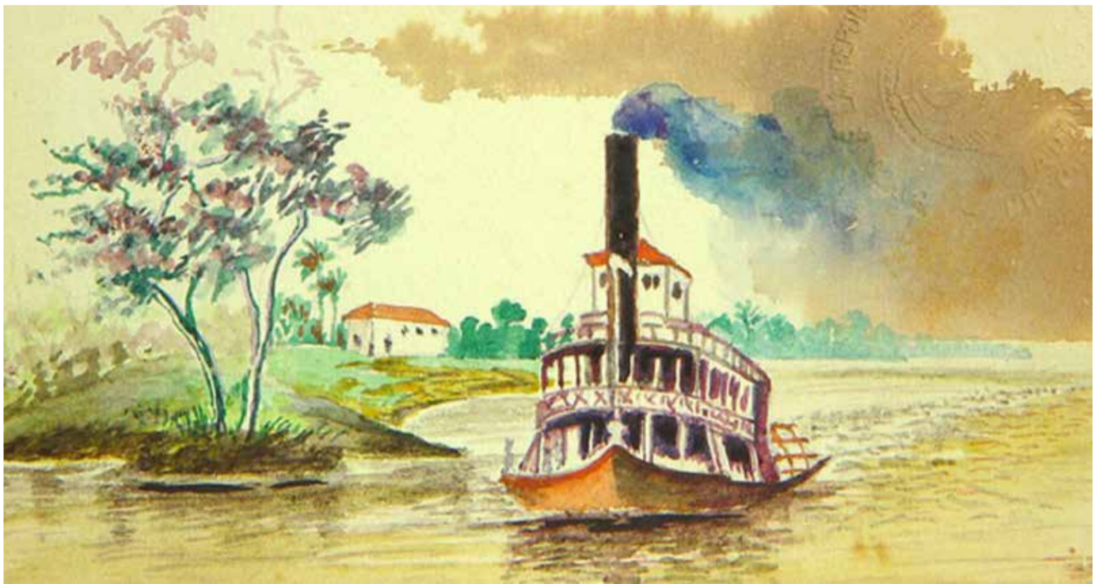
Navegando el río Magdalena

Llegada la independencia, el libertador, sus oficiales y su ejército, fueron los reales conocedores de nuestra geografía. Simón Bolívar, recorrió de Lima a Caracas y viceversa, no una, sino varias veces; en un mes y una semana atravesaba el país de sur a norte. Hoy el presidente