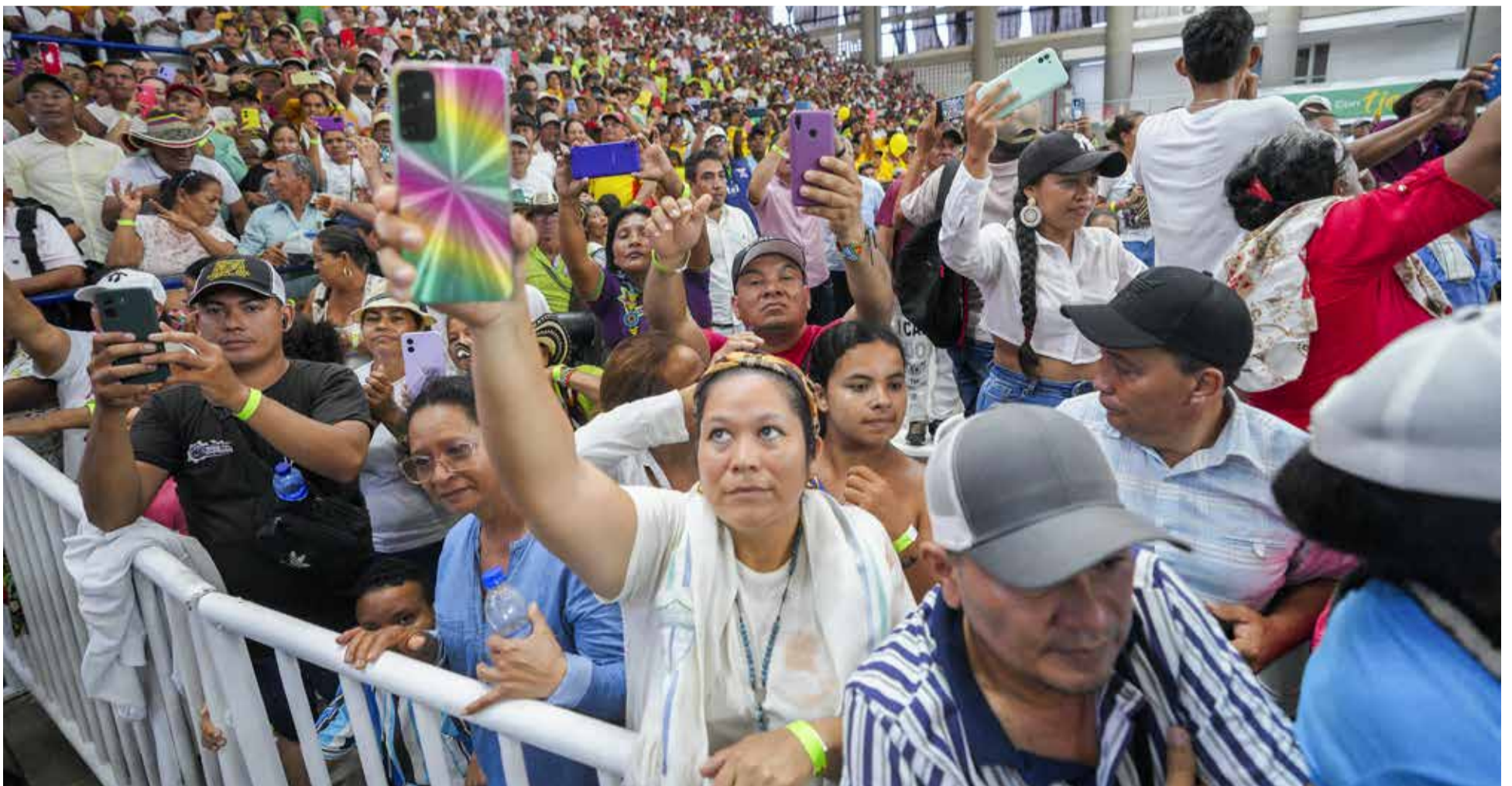
El encuentro de paz se cumplió en Montería con la masiva participación de sus habitantes.