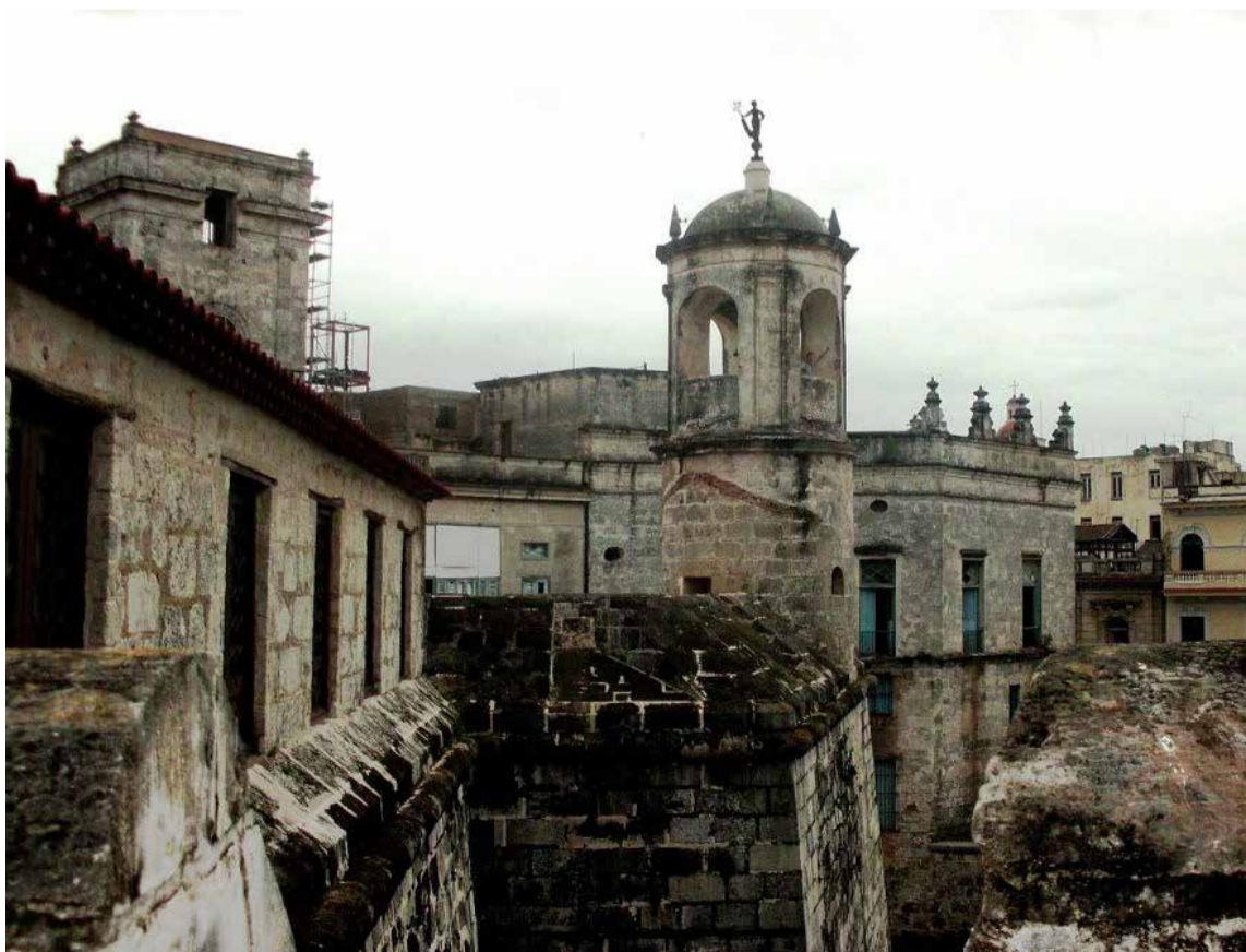
El Castillo de la Gran Fuerza

nazos en julio de 1555. Alrededor de 1565 se inició la construcción del Castillo de la Gran Fuerza, finalizada en 1885. Muchas de sus paredes tienen diez metros de espesor capaces de soportar el cañeo de la época. La obra con el decursar del tiempo fue obsoleta como fortaleza militar, ya que la ciudad debía ser defendida desde la entrada de su bahía.