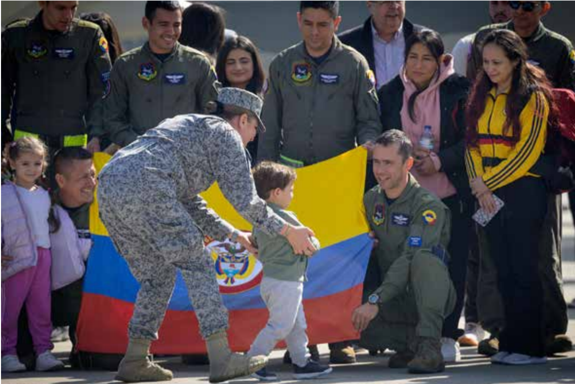
La tripulación quizó tener su recuerdo con los nacionales que llegaron huyendo de la guerra.