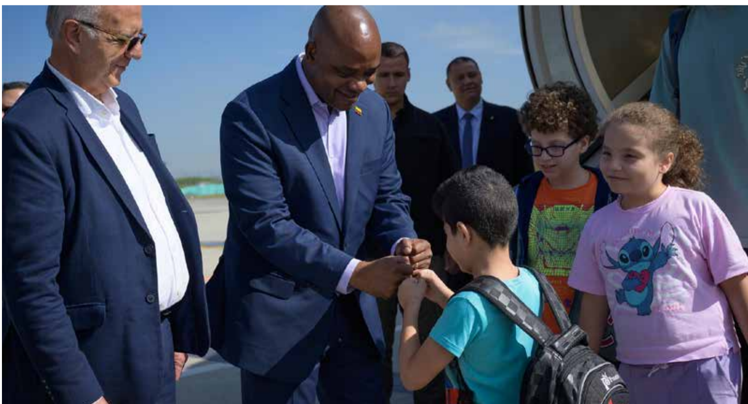
Los ministros de Defensa y de Relaciones Exteriores dieron la bienvenida a los colombianos que retornaron.